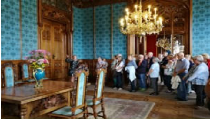
2019 Dreischlösserfahrt: Wilfersdorf-Lednice(Eisgrub)-Valtice (Feldsberg)

Gut angenommen werden die Tagesfahrten: z.B. Laa mit Brantner u. Hubertus, Laa-Stadtführung u. Kutschenmuseum, Südmährermuseum, Laa-orthodoxe Kirche, Michelstetten mit „Matura“, Pernhofen-Maisverarbeitung und Zwingendorf-Dorfmuseum, Fa. Berthold mit Führung, Loosdorf-Schloss mit Keramik und Zinnfiguren, Retz mit Reblausexpress nach Drosendorf, Draisinenfahrt von der „Alm“ bis Asparn, Hadres-Zeisslmuseum, Hochkar, Heidenreichstein, Schwechat /Flughafen, Ma. Taferl-Pöggstall, St. Pölten, Rust mit Mörbisch, zu den Stoakoglern, Heldenberg