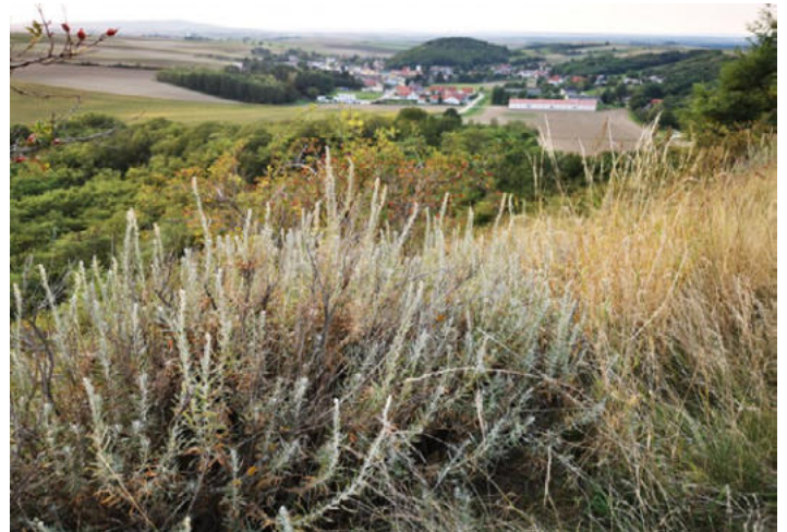
Hornmelde, Blau Wand, Oberschoderlee